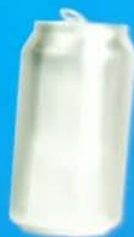
lata de alumínio 200 anos a degradar-se